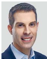
Thierry Burkart Präsident